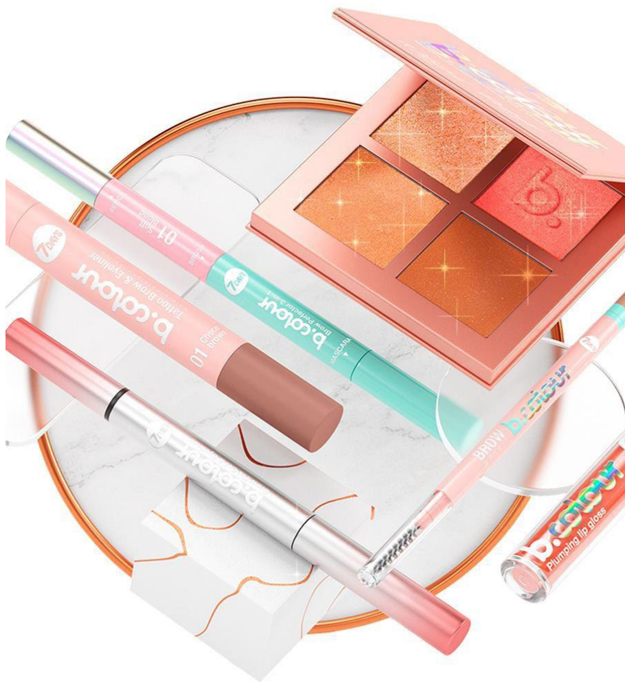
Коллекция косметики 7Days B. Colour, 7Days