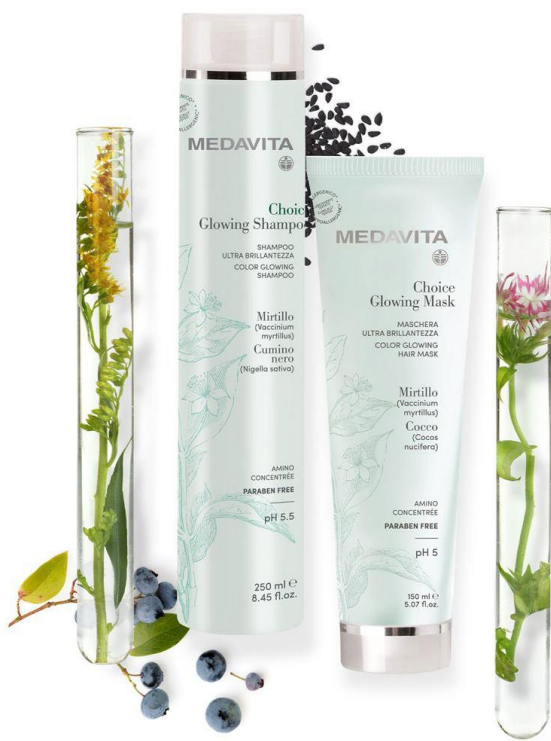
Шампунь и маска Choice Glowing, Medavita