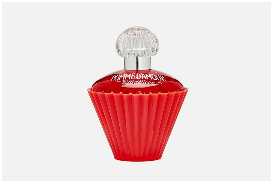
Туалетная вода Pomme d'amour, Tutti délices