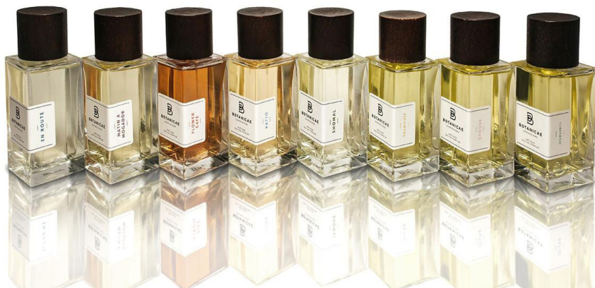
Коллекция ароматов Botanicae Expressions