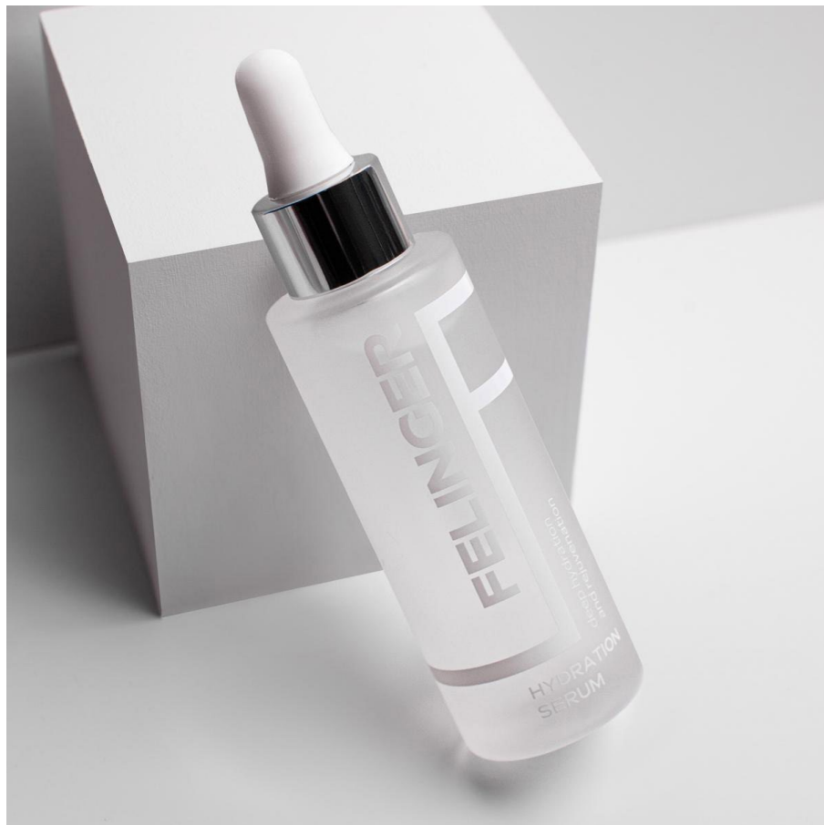
Сыворотка для ухода за лицом и телом Hydration Serum, Felinger

универсальными оттенками, базовыми текстурами и формулами, которые подойдут для макияжа на каждый день. Они хорошо держатся и не сушат кожу. В составы входят ценные масла, растительные экстракты и витамины.