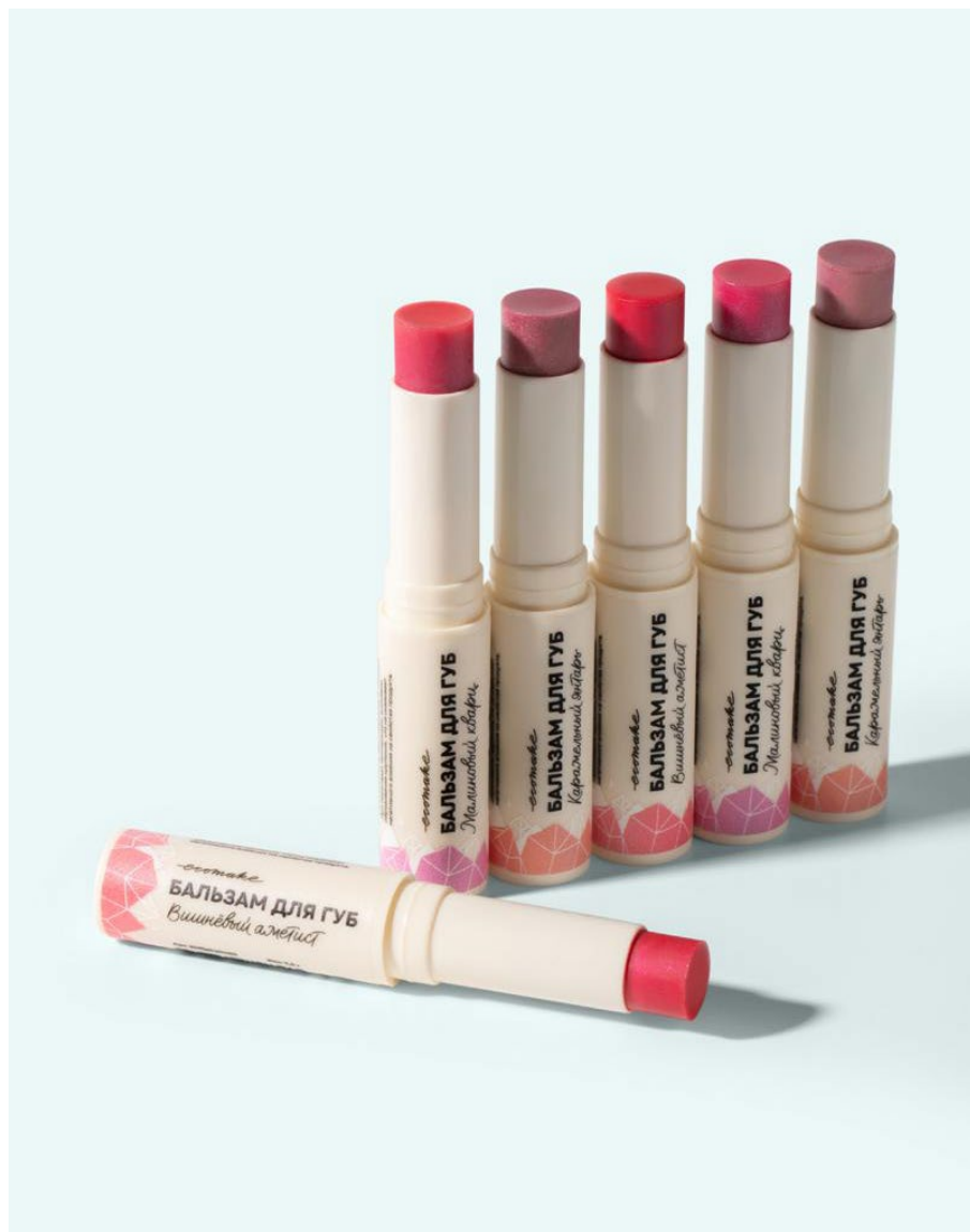
Оттеночные натуральные бальзамы для губ 2 в 1, Есотакэ

Вдохновением для создания бальзамов послужили природные минералы. Новинки мгновенно увлажняют и питают кожу, а натуральный пигмент за счет невесомого покрытия подчеркивает естественный цвет губ и делает их визуально объемнее. В составе бальзамов — масла миндаля и кокоса, пчелиный воск и витамин Е.