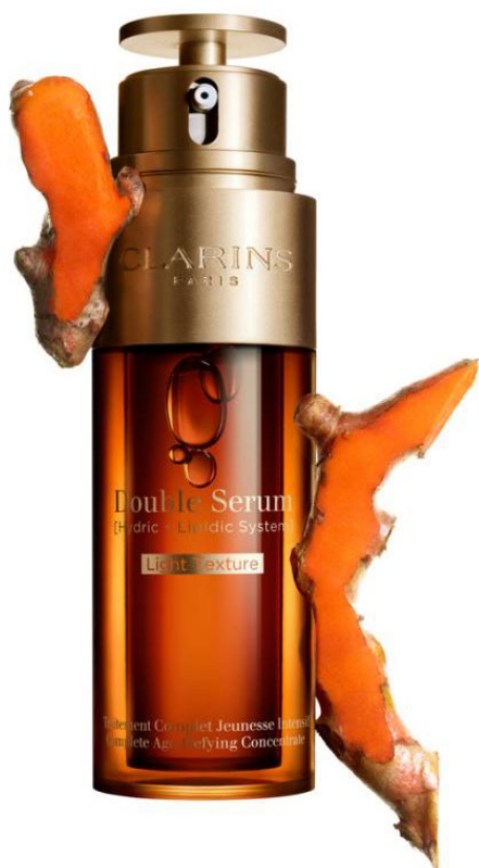
Сыворотка Double Serum, Clarins