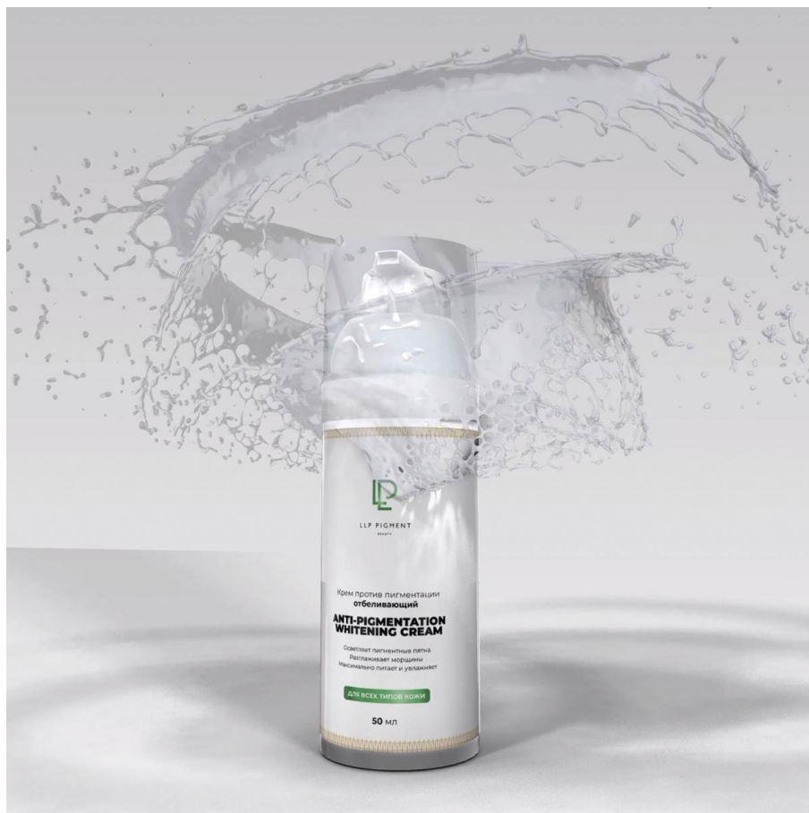
Крем отбеливающий против пигментации, LLP Pigment