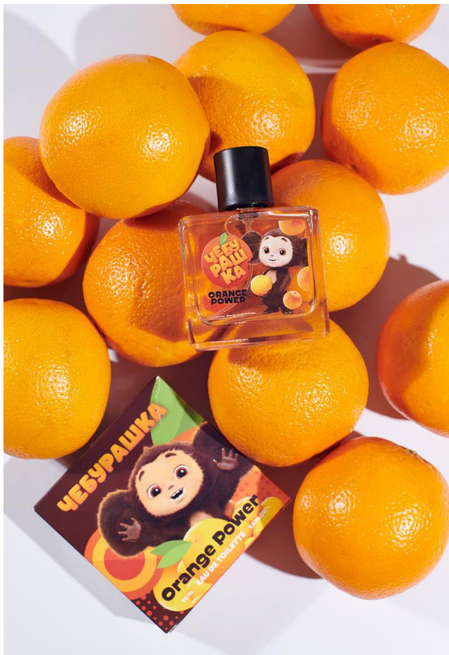
Туалетная вода Orange Power, «Чебурашка»